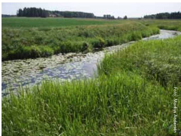
Sagaån i Norrströms avrinningsområde, Västmanlands län

En å är oftast större än en bäck och mindre än en älv, men det finns inga tydliga storleksgränser mellan dem och ett vattendrag som benämns bäck i norra Sverige kan vara större än en å i södra delen av landet.