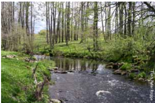
Hörbyån i Ronne ås avrinningsområde, Skåne län

De största avrinningsområdena har Göta älv med drygt 50 000 km 2 och Torneälven med knappt 40 000 km 2 . Det är också dessa två vattendrag som har de största avrinningsområdena som sträcker sig utanför Sveriges gränser. Av Göta älvs avrinningsområde ligger 15 % i Norge och av Torneälvens avrinningsområde ligger 36 % i Finland. Ångermanälven har det tredje största avrinningsområdet, drygt 30 000 km 2 .