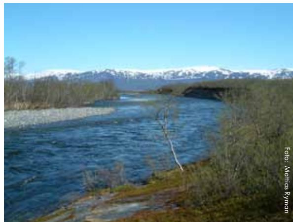
Abiskojokk vid Torneträsk i Norrbottens län

Om en sjö har flera utlopp som går vidare till olika vattendrag, kallas även detta en bifurkation. En förgrening kan också förekomma vid ett vattendrags mynning. Ett exempel är Göta älv som vid Kungälv delar upp sig i två grenar; Nordre älv och Göta älv.