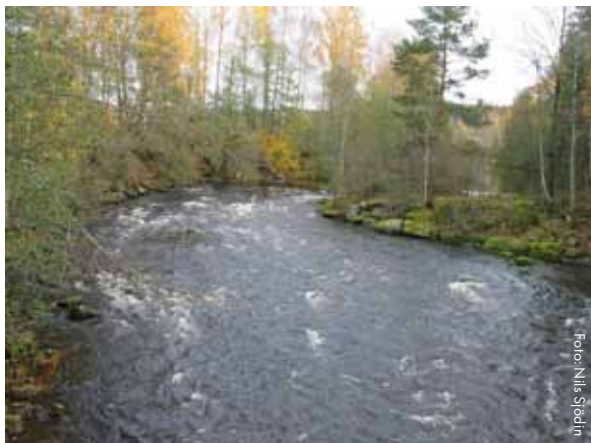
Vaggeälven i Byälvens avrinningsområde, Värmlands län