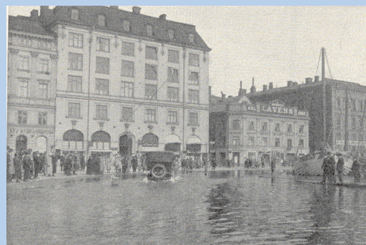
Översvämning i Stockholm 1924