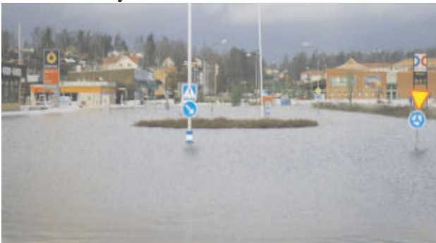
Arvika november 2000

I Sverige är vi relativt förskonade från sådana stora översvämningkatastrofer och dödsfall i samband med översvämningar är här mycket sällsynta. De materiella skadorna och kostnaderna för samhället till följd av översvämningar är dock betydande.