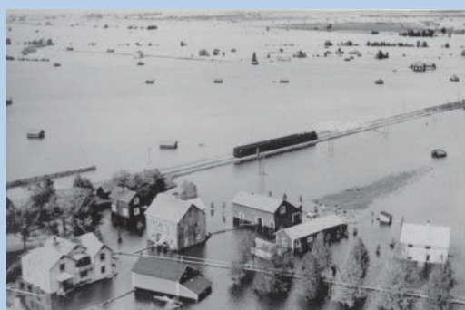
Spölandskatastrofen 1938

Närmare beskrivningar av översvämningarna och ytterligare exempel före år 1900 återfinns på SMHIs hemsida ( www.smhi.se ). Sammanställningen bygger på den information om översvämningar som finns på SMHI och urvalet har påverkats av vilken dokumentation som finns tillgänglig. Senare års översvämningar har därför mer detaljerade beskrivningar, medan äldre års händelser kan vara knapphändig eller ofullständigt beskrivna.