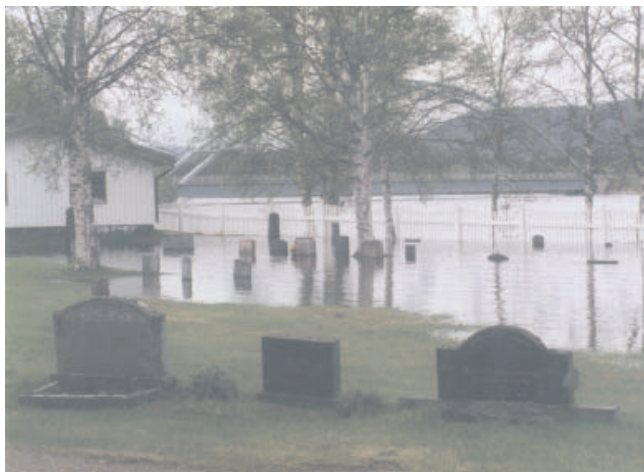
Sorsele kyrkogård i juni 1995

I de reglerade Norrlandsälvarna kunde vattenkraftmagasinen lagra en stor del av vårfloden och därmed dämpa flödet, men översvämningssproblem förekom ändå på många platser där regleringsmagasinen inte räckte till. De största problemen erhöles dock i de älvar som saknar eller har mindre regleringar. Längs Vindelälven och Piteälven översvämmades bostäder och många sommarstugor, liksom vägar och broar som skadades svårt. Vid Piteälven erhöles de största problemen i Älvsbyn. Vid Vindelälven gjordes stora invallningar vid Sorsele och vid mynningsområdet i Spöland-Vännäsby, vilket medverkade till att skadorna där blev mindre omfattande än under katastrofåret 1938.