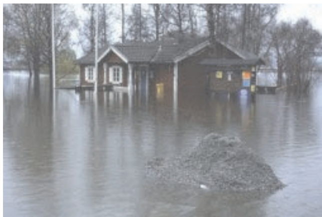
Arvika turistbyrå i november 2000

Det översvämningssdrabbade området i södra Norrland fick betydligt mer regn än normalt under perioden april till juni, vilket medförde att markfuktigheten redan var hög när stora regnmängder föll i juli. Under perioden 12-25 juli kom på många platser i de inre delarna av södra Norrland drygt 200 mm regn. I de reglerade vattendragen tappades vattenmagasinen för att förhindra överdämning. Översvämningar med omfattande skador på byggnader och infrastruktur inträffade i nordöstra Dalarna, Hälsingland, Medelpad, östra Jämtland och i södra Ångermanland.